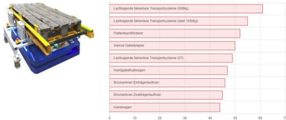
Abbildung 5. Ergebnis der Transportmittelauswahl in der Webapplikation

Unsere Empfehlung: Lasttragende fahrerlose Transportsysteme (500kg)